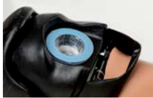
Kopf des AmbuMan mit Einweg-Luftbeutel im Kopfinnen